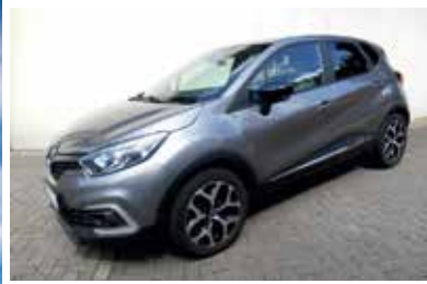
Renault Captur TCe 90 Experience

EZ: 03.2018 KM: 31100 KW / PS: 66 / 90 TÜV / AU: NEU