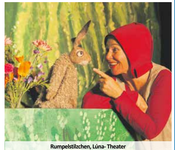
Rumpelstilzchen, Lúna- Theater

Gastspiel des Lúna- Theaters, 10 Uhr für Grundschulen, 14.30 Uhr für Kitas Halle der Mozartschule, Rodalben