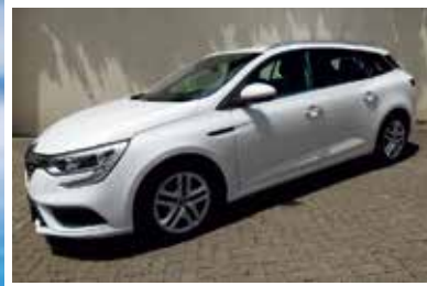
Renault Megane Grandtour dCi 110 EDC Business Edition

EZ: 05.2018 KM: 98900 KW / PS: 81 / 110 TÜV / AU: NEU