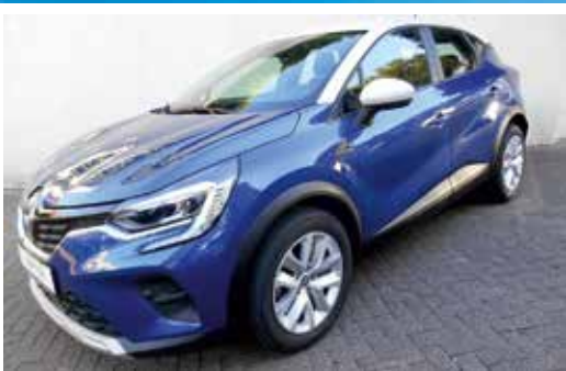
Renault Captur TCe 90 Zen

EZ: 09.2021 KM: 16200 KW / PS: 66 / 90 TÜV / AU: NEU