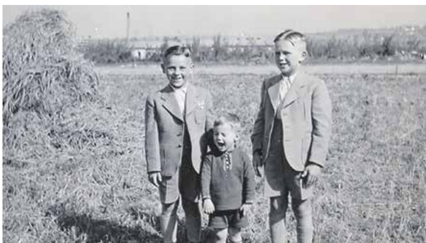
Der Tag im „Häusel“ ist für Kinder eine spannende Zeitreise in die Vergangenheit.

Im Rahmen des städtischen Ferienprogramms können Kinder im Alter von sieben bis zehn Jahren im Juli und August auf eine spannende Zeitreise gehen. Mädchen und Jungen können dem Leben ihrer Vorfahren bei einem Tag im „Häusel“ des Historischen Vereins nachspüren. An allen vier Terminen sind noch Plätze verfügbar.