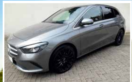
Mercedes Benz B250 7G-DCT Progressive

EZ: 02.2019 KM: 36100 KW / PS: 165 / 225 TÜV / AU: NEU