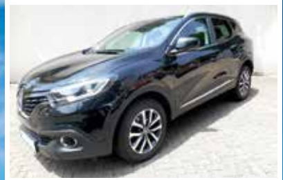
Renault Kadjar TCe 130 Collection

EZ: 06.2018 KM: 35490 KW / PS: 96 / 130 TÜV / AU: NEU