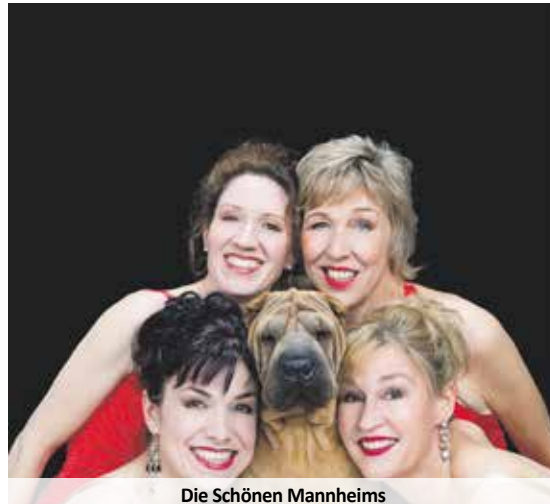
Die Schönen Mannheims

Samstag, 8. Oktober 2022, 20 Uhr „Best-of- Programm“ der „Schönen Mannheims“ Kabarett mit viel Ironie und Musik von vier Powerfrauen Halle der Mozartschule, Rodalben