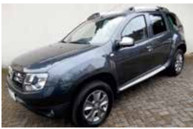
Dacia Duster Prestige TCe 125

EZ: 07.2014 KM: 41300 KW / PS: 92 / 125 TÜV / AU: NEU