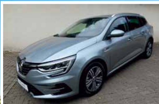
Renault Megane Grandtour TCe 140 Intens

EZ: 01.2021 KM: 9800 KW / PS: 103 / 140 TÜV / AU: NEU