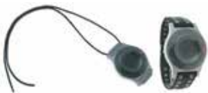
Als Halskette oder Armband tragbar

Sicherheit und Unabhängigkeit durch den ASB-Hausnotruf sind erstaunlich preiswert. Die Kosten liegen bei 25,50 €* (Standardanschluss). Optional: Dienstleistungspauschale 15 € (Schlüsselhinterlegung/24-Std. Hintergrunddienst) *Bei alleinlebenden Pflegebedürftigen mit Pflegegrad übernimmt die Pflegekasse die Kosten